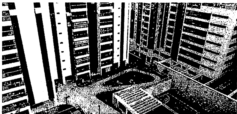
TODAS AS DEZ CAPITAIS PESQUISADAS TIVERAM ALZA NOS PREÇOS DOS IMÓVEIS, SEGUNDO DADOS DIVULGADOS PELA ABCEIP

O preço nominal médio dos imóveis residenciais cresceu 0,28% em abril. No acumulado dos últimos 12 meses, a alta atingiu 1,09%.