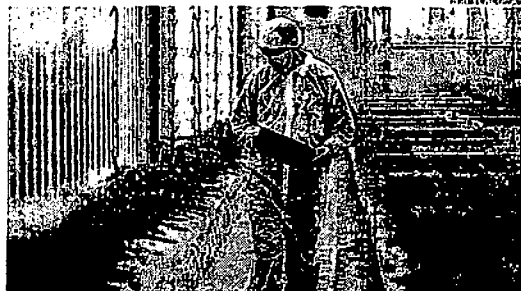
PRODUÇÃO DE CANNABIS EM UNIDADE DA TILRAY EM TERRITÓRIO PORTUGUÊS

Segundo o mesmo estudo, a força de trabalho relacionada ao mercado