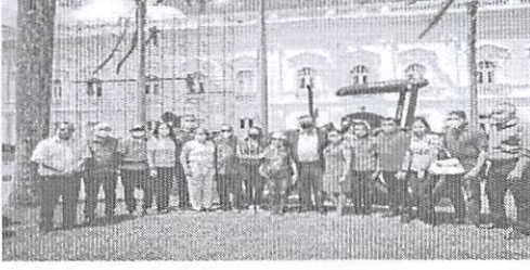
A PATRULHA MECANIZADA VAI PROPORCIONAR MAIS PRATICIDADE AOS PRODUTORES