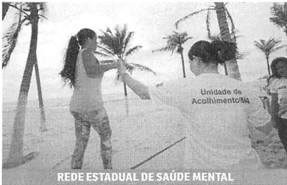
REDE ESTADUAL DE SAÚDE MENTAL