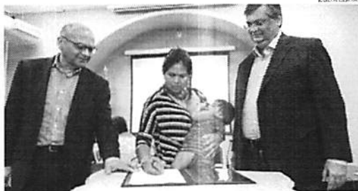
É UM MOMENTO DE DUPLA VITÓRIA DO MOVIMENTO INDÍGENA BRASILEIRO

A Coepi-MA vai funcionar como um canal de diálogo entre órgãos do poder executivo estadual, entidades representativas e lideranças dos povos indígenas do Maranhão. O objetivo é garantir que as medidas constantes no Plano Decenal Estadual de Políticas Públicas para os Povos Indígenas no Maranhão (PPPI) sejam promovidas de forma democrática e participativa. A comissão é coordenada pela