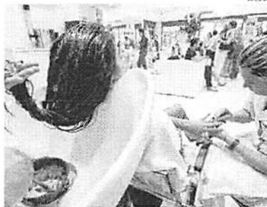
Segmento da beleza registrou queda expressiva no estado em abril

O Instituto Brasileiro de Geografia e Estatística (IBGE) divulgou, na manhã de ontem, a Pesquisa Mensal de Serviços (PMS), referente ao mês de abril. Trata-se de um panorama conjuntural do setor de serviços da economia brasileira. Fazem parte do painel estatístico da pesquisa empresas formalmente constituídas, com 20 ou mais pessoas ocupadas, que desempenham como principal atividade um serviço não-financeiro, excluindo o setor de administração pública, defesa e segurança social da Classificação Nacional de Atividades Econômicas (CNAE).