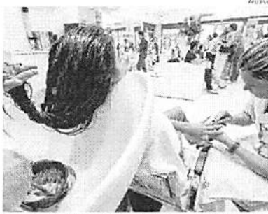
Segmento da beleza registrou queda expressiva no estado em abril

O Maranhão, nesse tipo de índice de base temporal, mês/mês imediatamente anterior, desde novembro/2019, nunca mais apre-