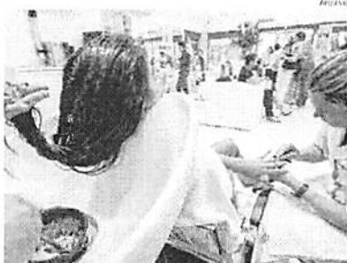
Segmento da beleza registrou queda expressiva no estado em abril

O Maranhão, nesse tipo de índice de base temporal, mês/mês imediatamente anterior desde novembro/2019, nunca mais apre-