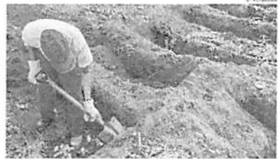
Número de mortos no Brasil é atualmente maior que na China