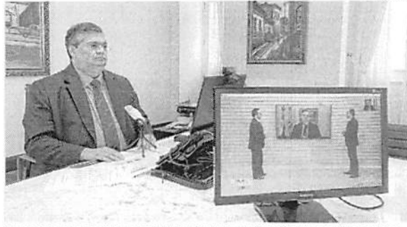
Governador Flávio Dino disse que lockdown será somente na ilha de São Luís e na próxima semana